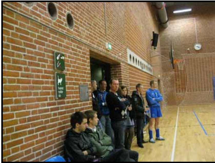
Futsal-stævne i Buddingehallen

Lige nu er vi fuld gang med denne sæsons futsalturnering. I skrivende stund kæmper mester-rækkeholdet en hård kamp i toppen af rækken, som de med en smule medvind sagtens kan vinde.