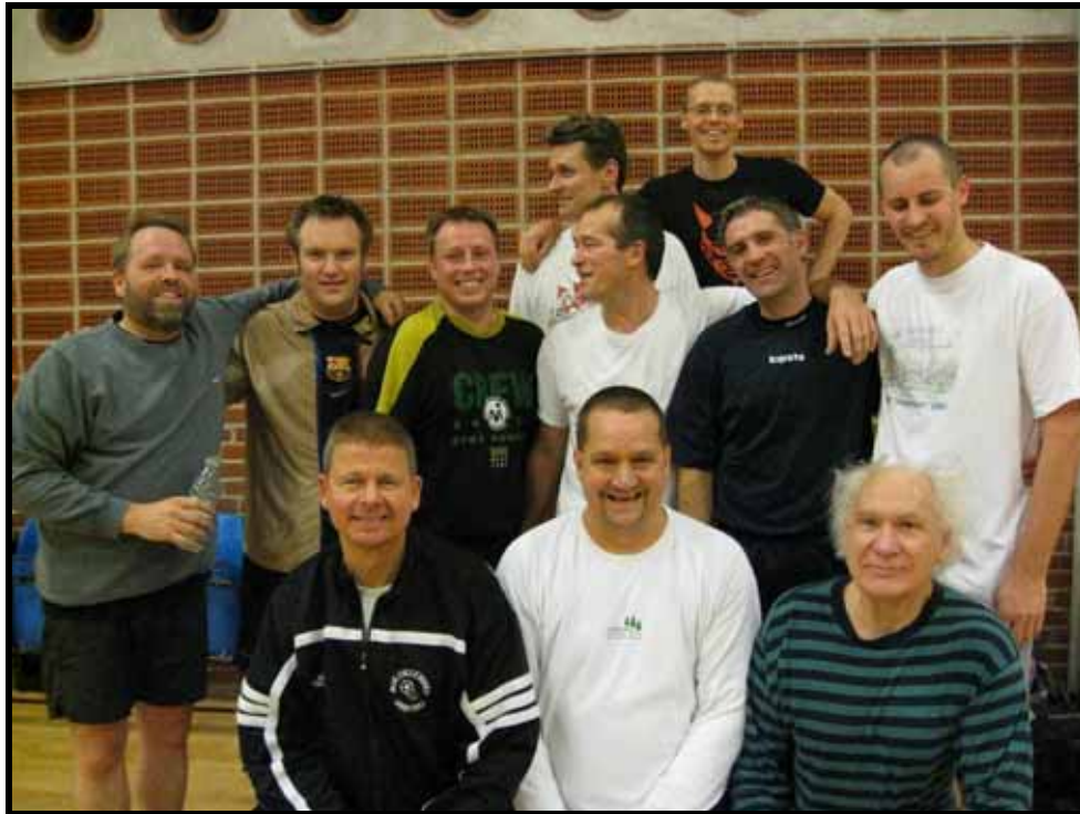
"Nymosen - den var go'!"

Desværre er resultaterne ikke så gode som ønsket hverken for damerne eller herrerne. Det er ikke til at forstå. Vi er så heldige at have nogle super dygtige og meget engagerede trænere, og der er mange talentfulde spillere i klubben og nogen endda i bedre form end nogensinde. Vi håber på og krydser fingre for en super slutspurt, så sæsonafslutningen i år kan blive en del mindre nervepirrende end forrige sæson.