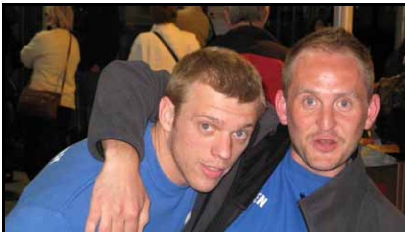
Vi skal passe på hinanden