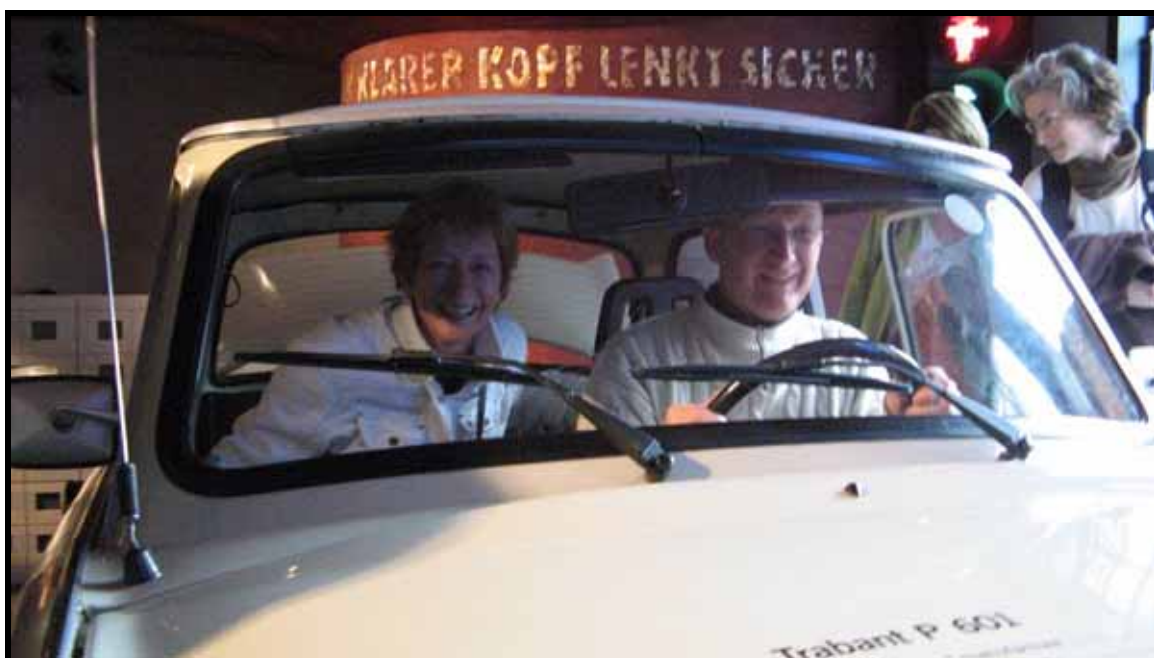
"Så kører vi"

Debatten om klubben før, nu og i fremtiden sker på generalforsamlingen, og vil du være med til at skabe de bedst mulige vilkår for en fortsat fantastisk boldklub, så mød op.