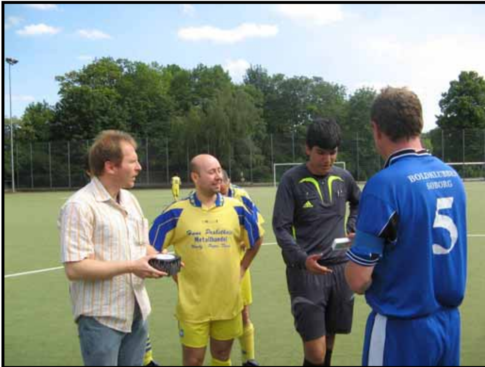
Også dommeren får selvfølgelig en gave inden kampen

På årets tur spillede pigerne håndbold mod HSG Charlottenburg. Efter et par år uden håndbold på Berlin turen, var det perfekt, at det igen var muligt. Vi spillede mod en ny klub, som vi ikke har haft kendskab til før, men som viste sig at være meget interesseret i et yderligere samarbejde med os. Så vi ser dem nok i Buddingehallen på et tidspunkt.