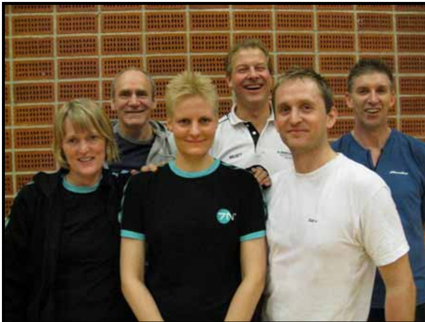
Det vindende hold af årets volleyballturnering

Fodboldbanens tilstand har i en årrække været fokuspunkt for bestyrelsen - og det vil den nok (desværre) også være i de kommende år. 2007 har ikke været et mareridts år som 2006, hvor banen var helt ødelagt og hvor vi i 4-5 måneder måtte flytte hele klubbens fodboldafdeling til Vadgård skole i foråret. I 2007 har vi været begunstiget af et for fodboldbanen rigtig godt vejr med meget sol og varme i foråret og en del regn i løbet af sommeren. Så i 2007 har vi "kun" kæmpet med en bane, der har farlige huller, er ujævn med render og nedslidte målefelter. I bestyrelsen vil vi kæmpe for at få banernes tilstand op på et bare rimeligt niveau, hvor det i hvert fald kan undgås at nogen kommer til skade på grund af huller i banen.