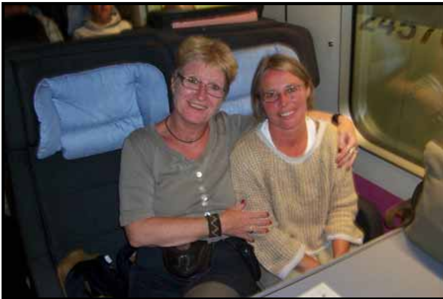
Vi skal passe på hinanden

Skolebanernes generelle tilstand blev drøftet på blandt andet FIG's årsmøde ikke mindst banen på Buddinge blev drøftet. Vi har gennem FIG fået gjort opmærksom på, at fodboldbanens dårlige tilstand skal medtages i Gladsaxe Kommunes plan for fritid og idræt, der danner rammen om den fremtidige idrætspolitiske linje.