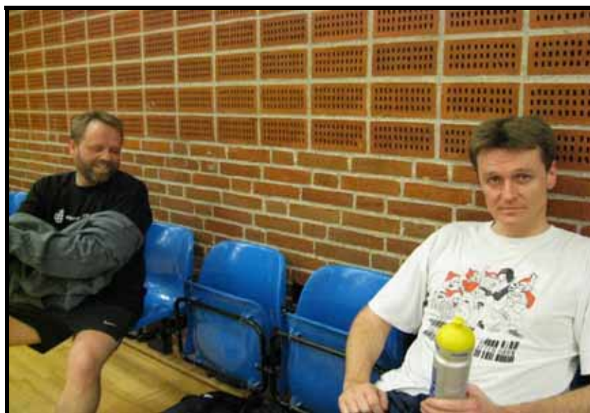
Der er plads til flere - på banen og på bænken.