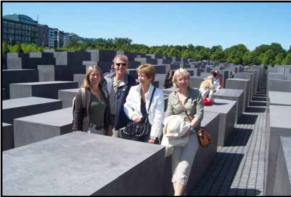
Kulturarv i Berlin og i Søborg

2007 har igen været et økonomisk godt år. Regnskabet ender dog med et underskud på knap 18.000 kr., men det skyldes primært, at der er et sponsorat, der ikke var indgået på bankkontoen ved regnskabets afslutning.