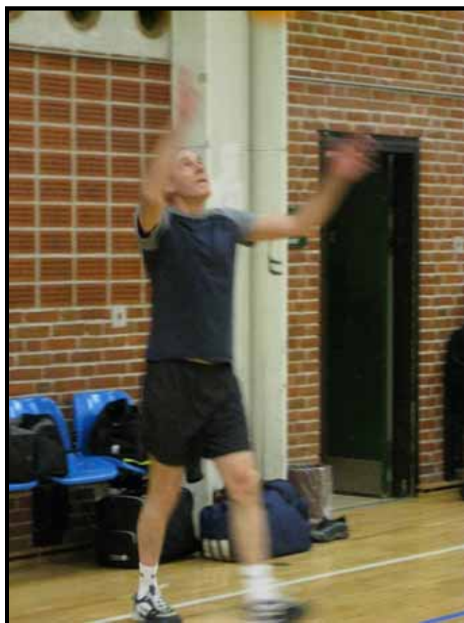
Et passivt medlem i aktion