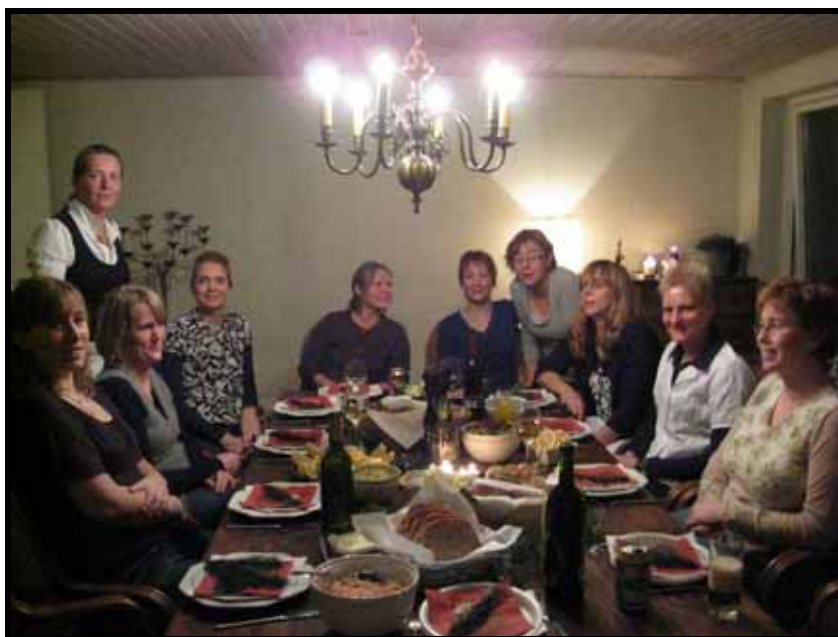
Stilhed før banko-stormen ved pigernes julefrokost

Men hvor er vi som klub i dette nye samarbejde og hvor er vi i det hele taget henne med intentionerne om et samarbejde klubberne i mellem - det må vi have afklaret.