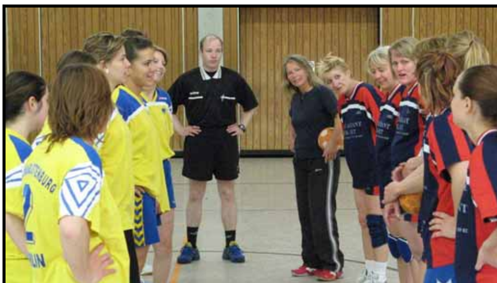
Landskamp i Berlin 2007