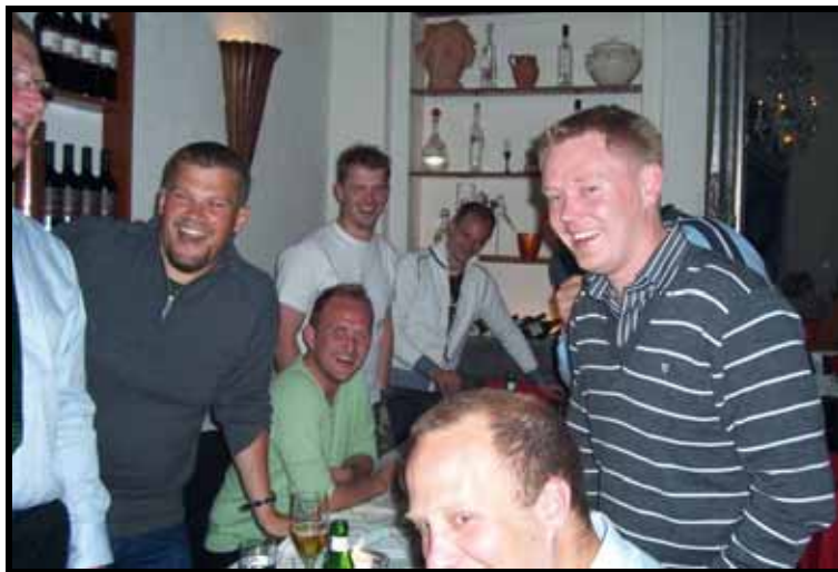
Fodbolddirektøren havde igen fødselsdag i Berlin

Som man har kunnet læse tidligere i beretningen blev 2007 ikke et mindeværdigt år for klubbens oldboys. Problemerne er ikke nye, men tegnede sig allerede i 2006, og kan koges ned til to forhold. For det første er vi formentlig det ældste oldboyshold i rækken. Vi havde sidste år kun ganske få spillere under 40, og det siger sig selv, at det kan være noget af en udfordring, når en del af modstanderne kun lige har rundet de 33 år, der er grænsen for at være med. For det andet var oldboys-truppen ikke bred nok. Når vi skulle tage højde for skader og de afbud, der uvægerligt vil komme når en stor del af spillerne har job og familie, var der simpelthen ikke spillere nok til, at vi kunne stille med et slagkraftigt hold hver gang. Enkelte gange måtte vi stille op med blot 10 spillere og én gang var vi tvunget til at melde afbud.